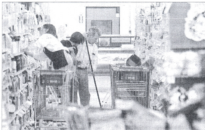
Molte cooperative operano nel settore delle pulizie e impiegano soprattutto donne

l'anno del trentennale della fondazione dell'Unione regionale di Confcooperative molti sono stati le occasioni di confronto e i momenti di interlocuzione istituzionale, in particolare con la Regione Umbria: un aspetto questo prioritario per riacquisire quella visibilità e quel "peso" nel panorama politico, legislativo e sociale regionale fondamentali per