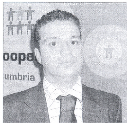
Il presidente di Confcooperative Andrea Fora

svoltisi a Terni in occasione dell'inaugurazione della nuova sede provinciale del 13 maggio scorso, sono stati organizzati diversi incontri con assessorati regionali e forze politiche; si è intensificato il rapporto con il sistema cameral e le parti sociali al fine di promuovere l'imprenditoria cooperativa; è stata intensificata l'attività di monitoraggio del fenomeno della cooperazione umbra lavorando perché nel 2006 possa essere costituito un Osservatorio regionale sulla cooperazione e convocata anche una conferenza regionale programmatica sulla cooperazione dopo l'ultima del 1996; è stato costituito un "Laborato-