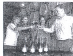
Si lavora ad un consorzio nel settore vitivinicolo